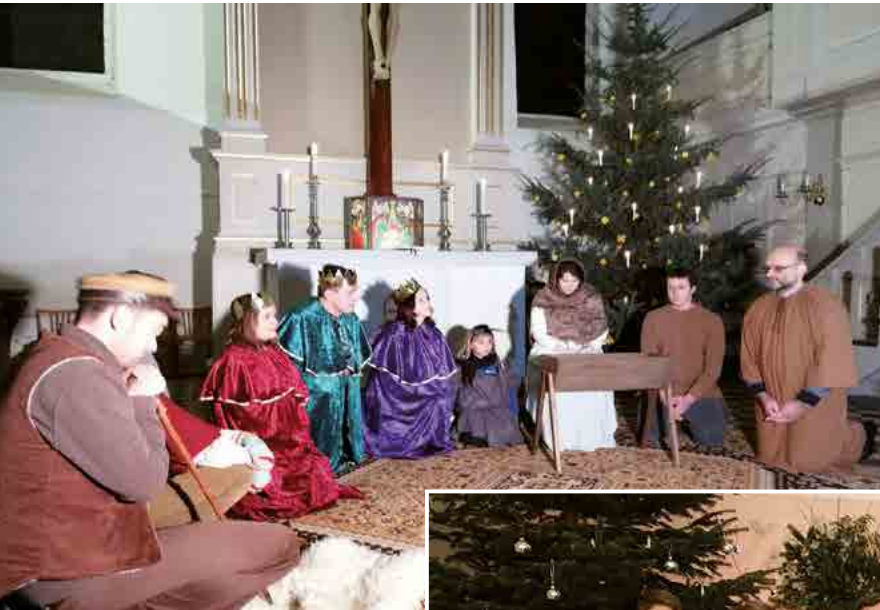
... in Gersdorf