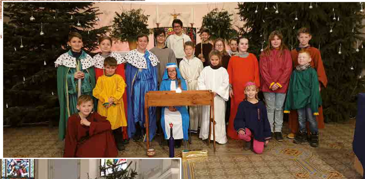
... in Hartha mit den Christenlehrekindern