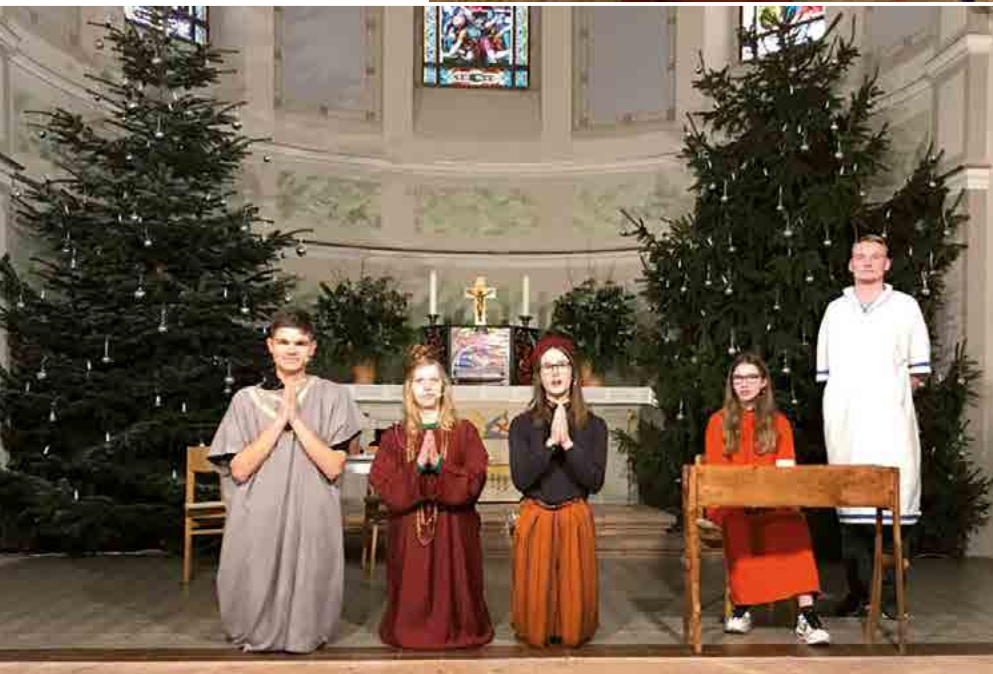
... in Hartha mit der Jungen Gemeinde