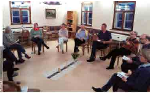
Kirchenvorstandsrüstzeit in Schmannewitz